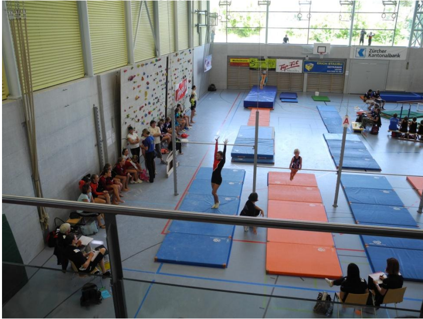
Mitten aus dem Wettkampf